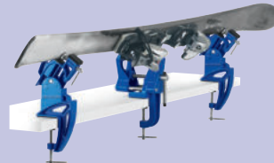
SuperProPlus World Cup – Art. 24432