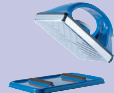
SmartWaxer – Art. 20603